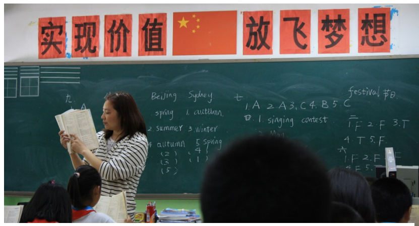
Engelskundervisning i 5.c. på Anminskolen i Beijing

Væggene i et kinesisk klasselokale er som regel fyldt med plancher med studerendes arbejder og fortjenstbeviser for elever, der har opnået gode resultater i forskellige konkurrencer på skolen. Der vil altid være et kinesisk flag og et klassemotto i lokalet.