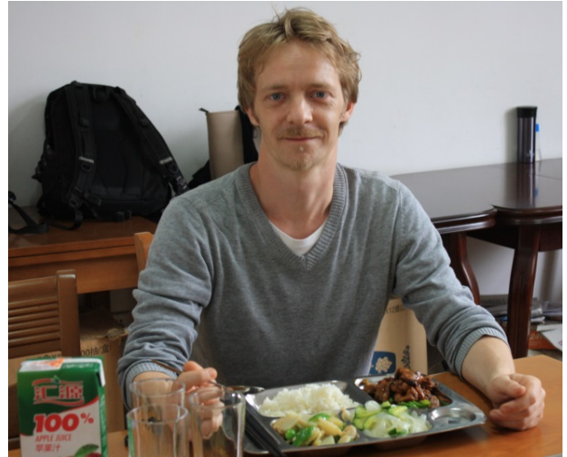
Man bliver glad og tilfreds af dagens menu

Karakteristika: Kødet i den færdige ret skal være brunt uden på og have taget spidskommen smagen til sig.